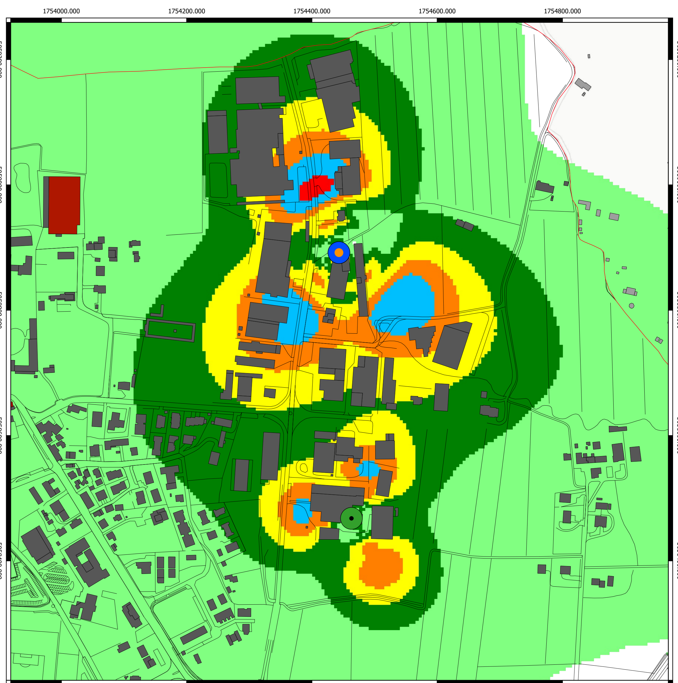
Campo elettromagnetico (V/m) calcolato alla quota di 12 m sul livello del terreno

LEGENDA Dati comunali Confine comunale Edifici sotto mappa Edifici sopra mappa Edifici fuori comune Cartografia