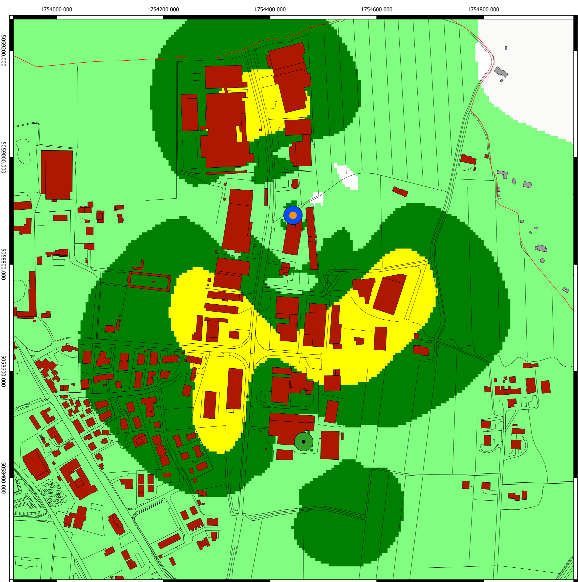
Campo elettromagnetico (V/m) calcolato alla quota di 2 m sul livello del terreno