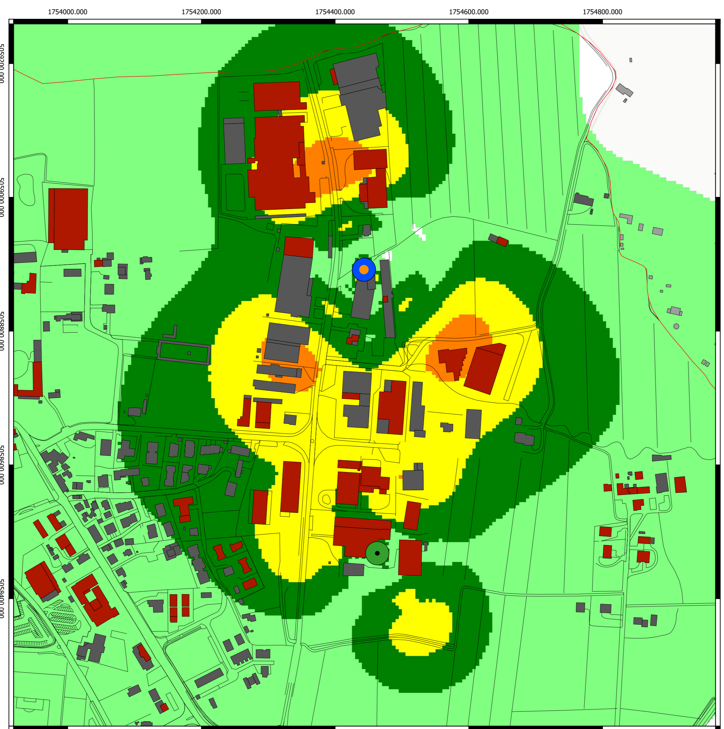
Campo elettromagnetico (V/m) calcolato alla quota di 7 m sul livello del terreno