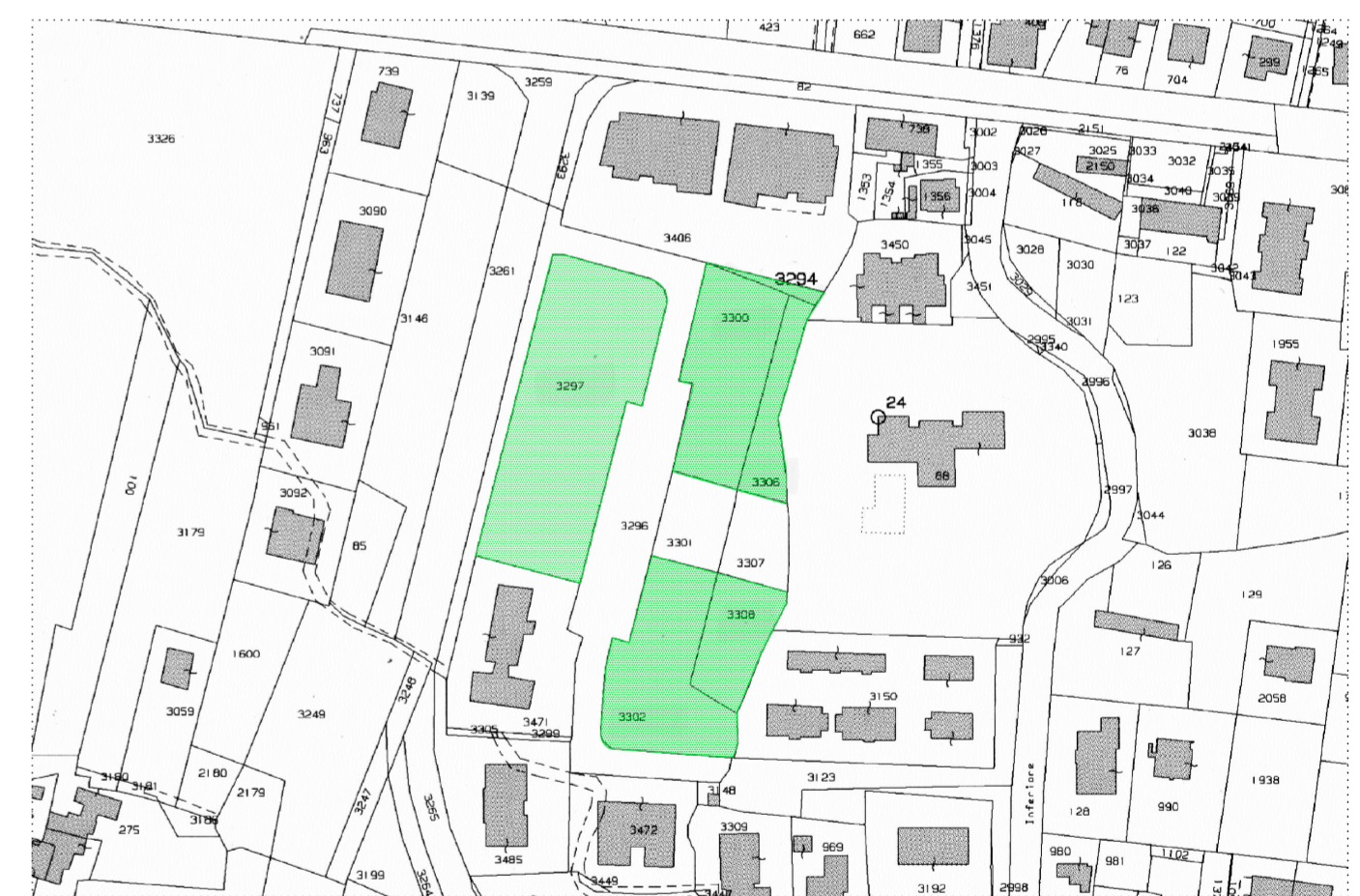
Estratto di mappa 1:2000 Comune di Casier Foglio 1 - mappali n. 3294 - 3297 - 3300 - 3302 - 3306 - 3308