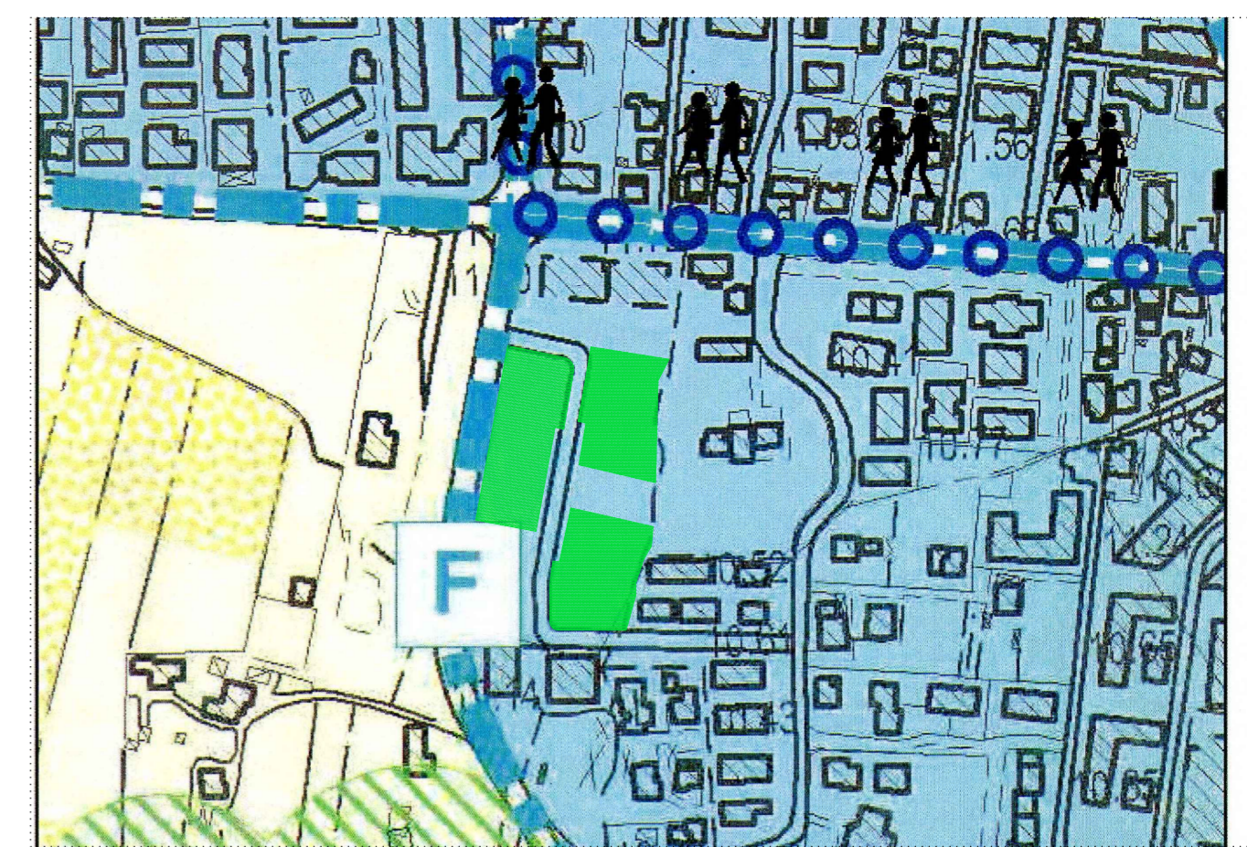
Estratto Piano di Assetto del Territorio Aree di urbanizzazione consolidata (art. 37 NT - PAT)